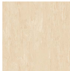
Flaxen 5 060 w/r 5330 NCS S 1010-Y30R LRV 60