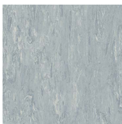
Ocean Blue 5 050 w/r 5350 NCS S 3005-R80B LRV 41