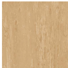
Golden Sand 5070 w/r 2500 NCS S 3020-Y10R LRV 43