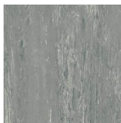
Steel Grey 5 030 w/r 9120 NCS S 4502-G LRV 32