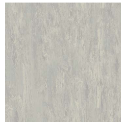
Silver Grey 5110 w/r 2090 NCS S 2500-N LRV 49