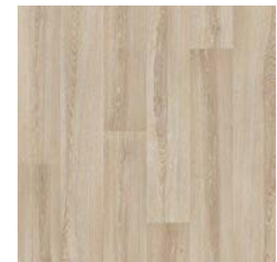
Warm Limed Ash 9953 plank size in sheet: 166 x 1500mm w/r 9832 LRV 34