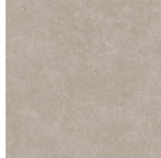
Sepia Cement 8960 w/r 9688 LRV 39