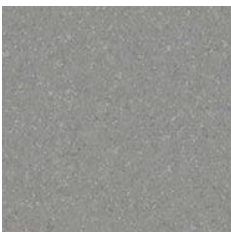
Storm 9973 w/r 9845 LRV 26