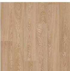
Blond Oak 9956 plank size in sheet: 167 x 1500mm w/r 9820 LRV 28