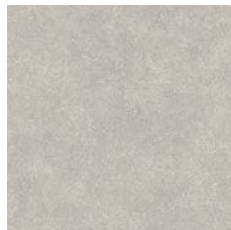
Dove Cement 8958 w/r 9685 LRV 43