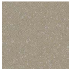
Moleskin 9975 w/r 9841 LRV 28