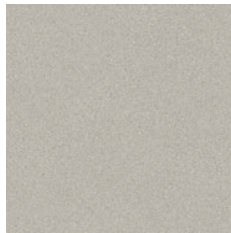
Oyster 8962 w/r 9693 LRV 42