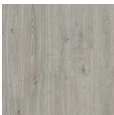
Silver Oak 9951 plank size in sheet: 200 x 1500mm w/r 9826 LRV 28