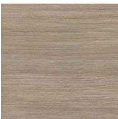
Honey Beige 9985 w/r 9869 LRV 29