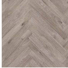
Upland Oak Parquet 8957 plank size in sheet: 88 x 700mm w/r 9679 LRV 33