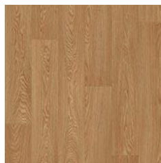
Honey Oak 9959 plank size in sheet: 167 x 1500mm w/r 9821 LRV 22