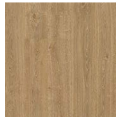
English Oak 9957 plank size in sheet: 200 x 1500mm w/r 9823 LRV 24