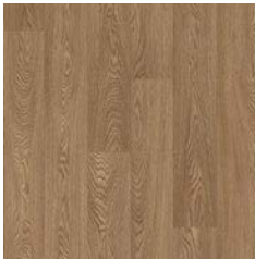
Toasted Oak 9960 plank size in sheet: 167 x 1500mm w/r 9822 LRV 18