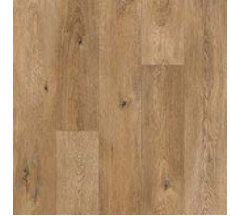
Serene Oak 8953 plank size in sheet: 200 x 1500mm w/r 9673 LRV 29