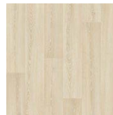
Classic Limed Ash 9955 plank size in sheet: 166 x 1500mm w/r 9833 LRV 49