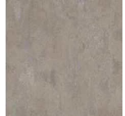
Warm Concrete 9967 w/r 9855 LRV 25