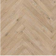
Eden Oak Parquet 8955 plank size in sheet: 88 x 700mm w/r 9677 LRV 40