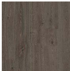
Smoked Oak 9963 plank size in sheet: 200 x 1500mm w/r 9827 LRV 11