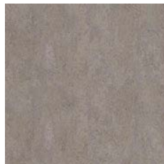
Dark Industrial Concrete 9970 w/r 9859 LRV 24