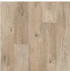
Ridge Oak 8952 plank size in sheet: 200 x 1500mm w/r 9672 LRV 34