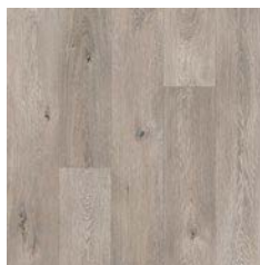
Upland Oak 8954 plank size in sheet: 200 x 1500mm w/r 9675 LRV 33