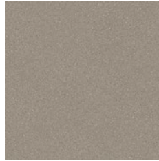
Pebble 8961 w/r 9691 LRV 29