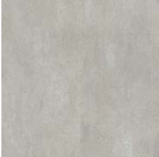
Light Grey Concrete 9965 w/r 9858 LRV 40