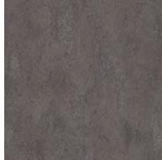
Dark Grey Concrete 9968 w/r 9857 LRV 13