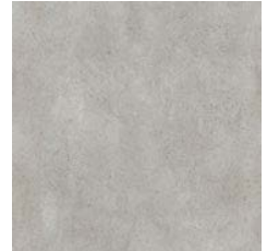
Light Industrial Concrete 9969 w/r 9860 LRV 35