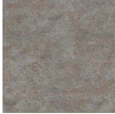
Copper Ornamental 9971 w/r 9861 LRV 19