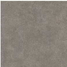
Pewter Cement 8959 w/r 9686 LRV 22