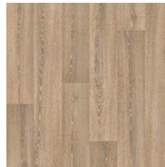
Roasted Limed Ash 9954 plank size in sheet: 166 x 1500mm w/r 9831 LRV 27