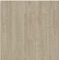
Sun Bleached Oak 9952 plank size in sheet: 200 x 1500mm w/r 9825 LRV 31