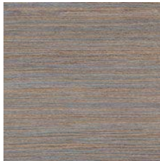
Autumn Rain 9986 w/r 9864 LRV 24