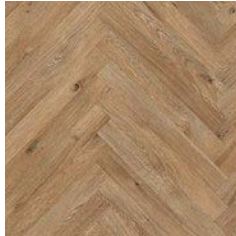
Serene Oak Parquet 8956 plank size in sheet: 88 x 700mm w/r 9678 LRV 30