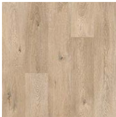
Eden Oak 8951 plank size in sheet: 200 x 1500mm w/r 9671 LRV 37