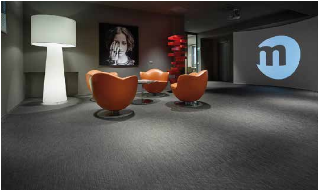
Marangoni Design School, Milano | Tatami Botanic