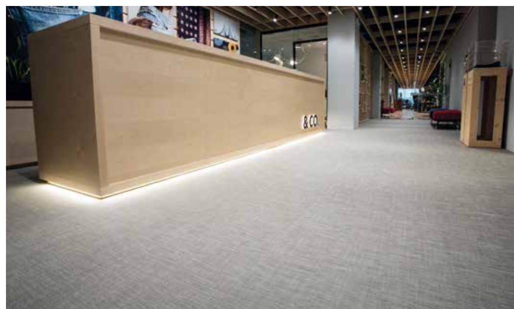
Uffici Levi's Milano | Tatami Silence in doghe

La scelta delle finiture d'interni determina la qualità globale degli ambienti, per questo, nel mercato dei pavimenti e rivestimenti per uffici, Liuni propone esclusivamente prodotti con caratteristiche tecniche ed estetiche di alta qualità, tutti rigorosamente certificati. Da oltre 50 anni, Liuni è sinonimo di garanzia e innovazione. L'elevata qualità, la facilità di manutenzione, la resistenza all'usura e la fono-assorbente, rappresentano le caratteristiche distintive dei materiali Liuni. Un'ampia gamma di prodotti che permette ai professionisti del settore di trovare sempre la soluzione idonea alle esigenze specifiche. Un unico fornitore in grado di soddisfare con puntualità le richieste del cliente, guidandolo in ogni fase del progetto fino alla sua completa realizzazione.