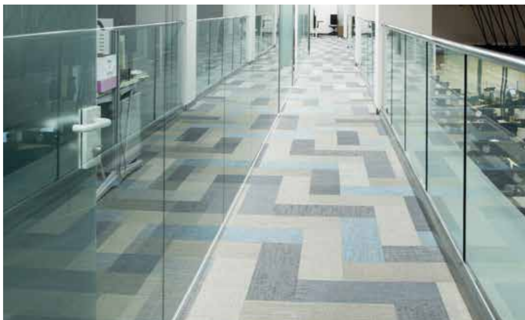
Wind Telecomunicazioni SpA, Milano | Tatami Silence in doghe