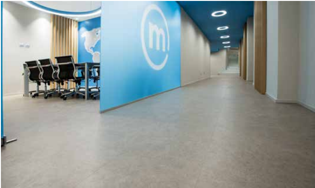
Banca Mediolanum, Ufficio promotori finanziari Gallarate | Expona Simplay Pur effetto pietra