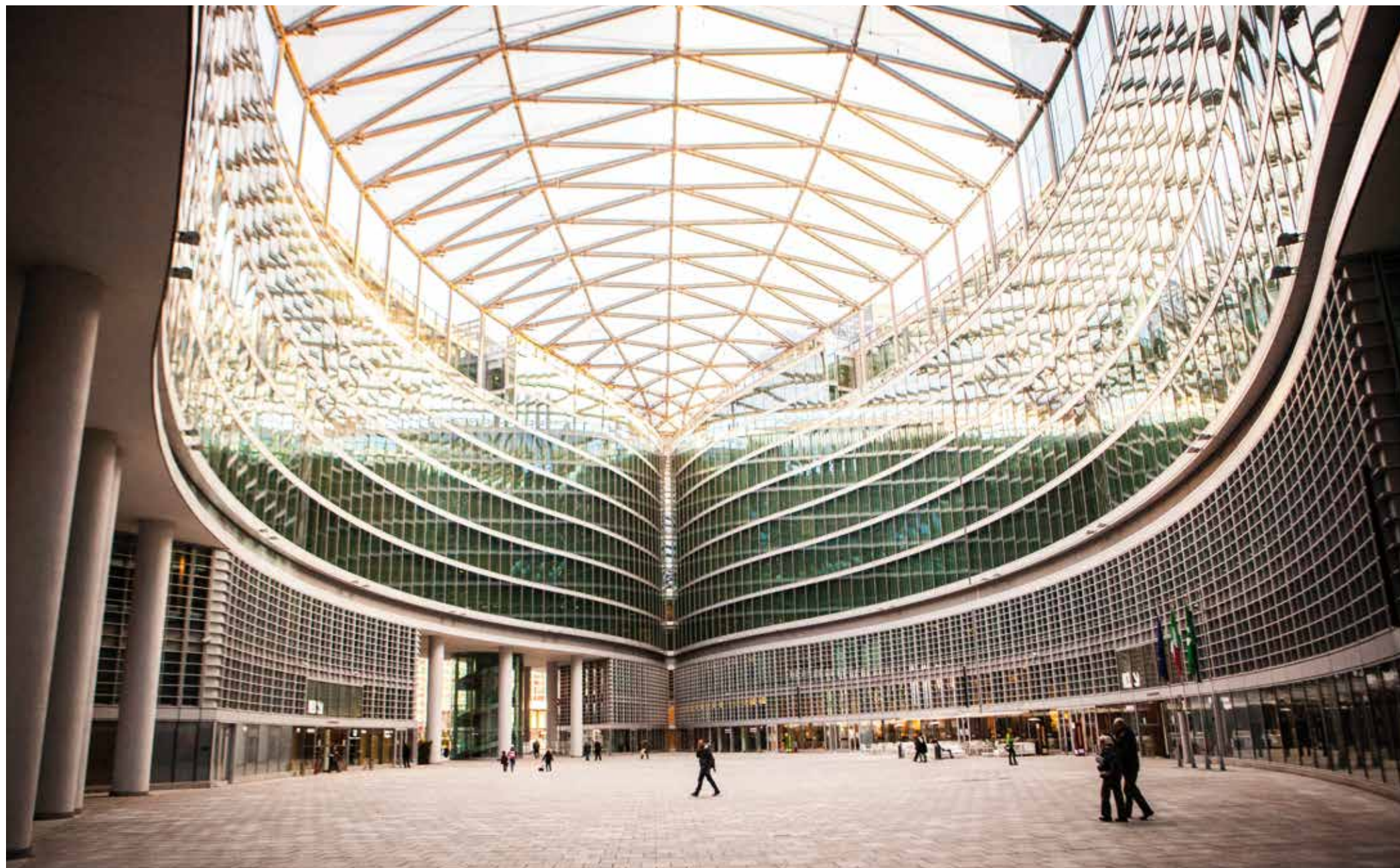
Palazzo della Regione Lombardia, Milano