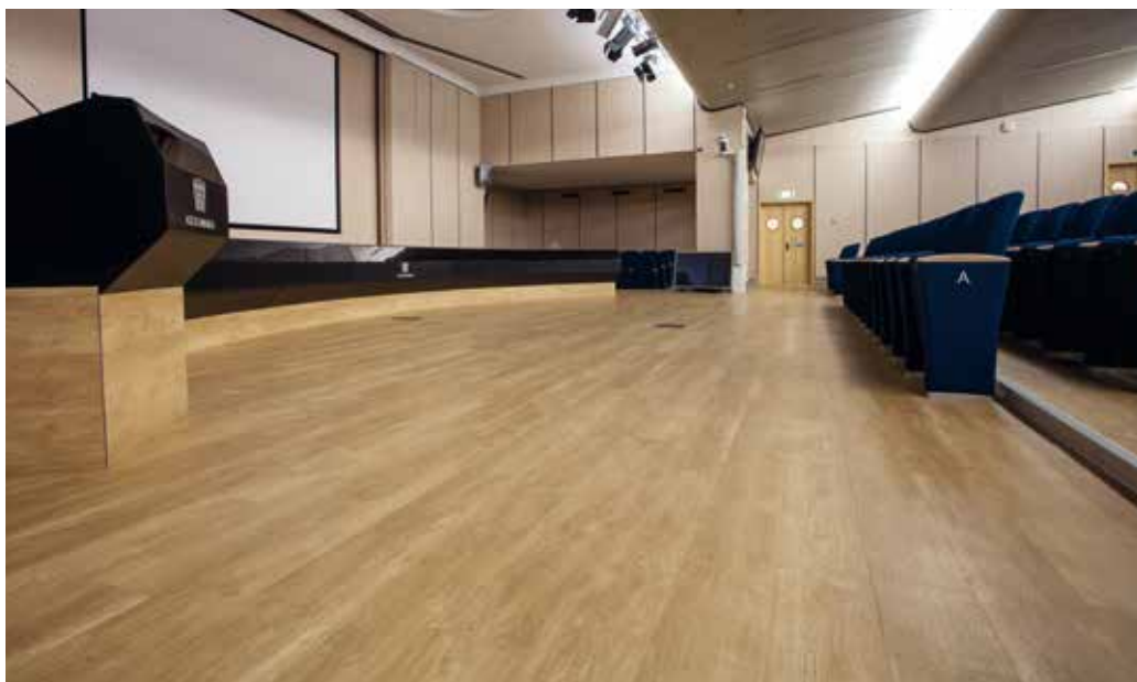
Centro Congressi Assolombarda, Milano | Expona Simplay Pur effetto legno