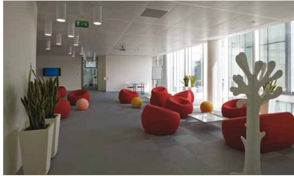
Zurich Headquarter, Milano | Tatami now