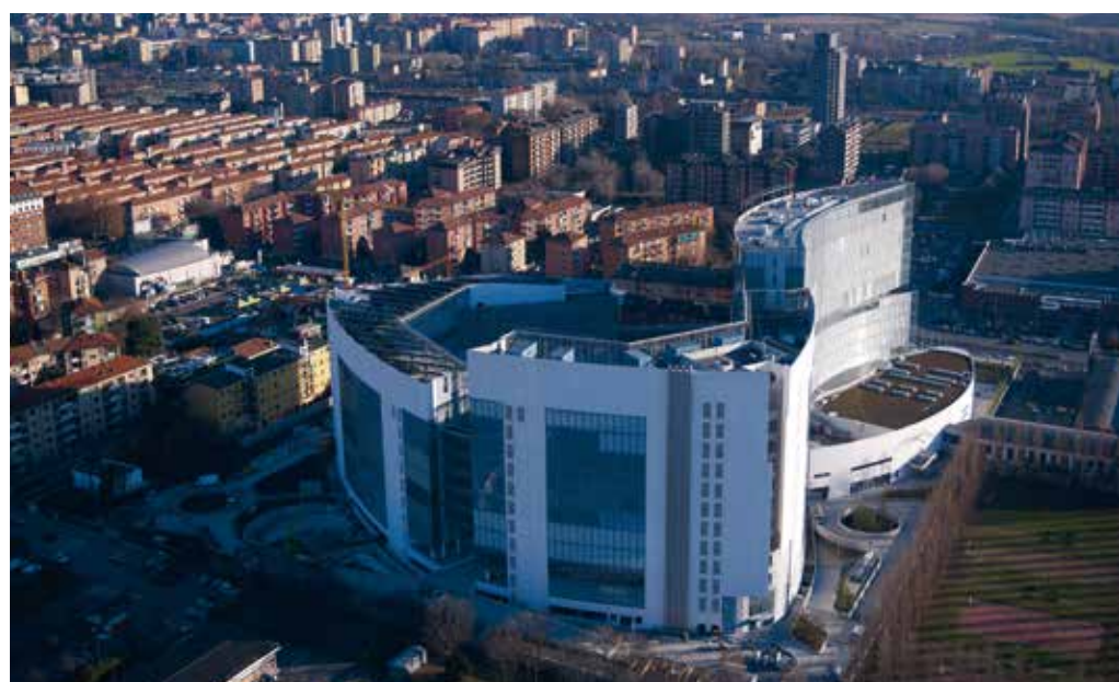
Vodafone Village, Milano