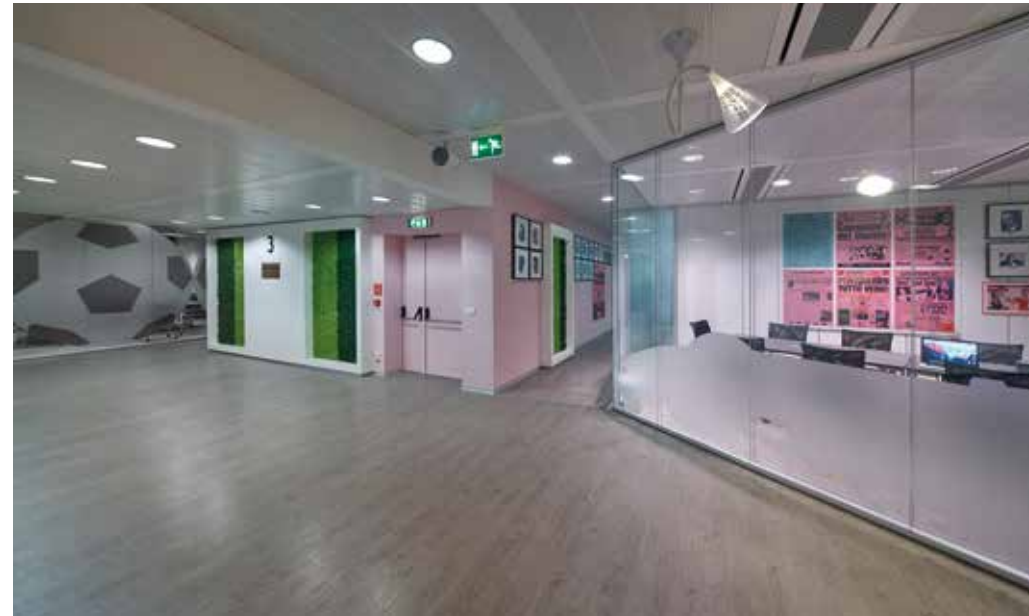
Gazzetta dello Sport, Milano | Salto effetto legno