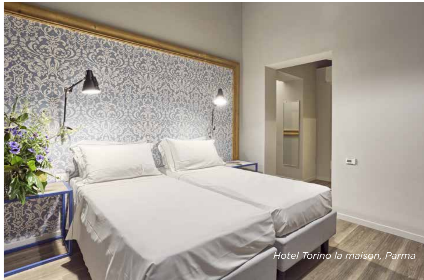
Hotel Torino la maison, Parma