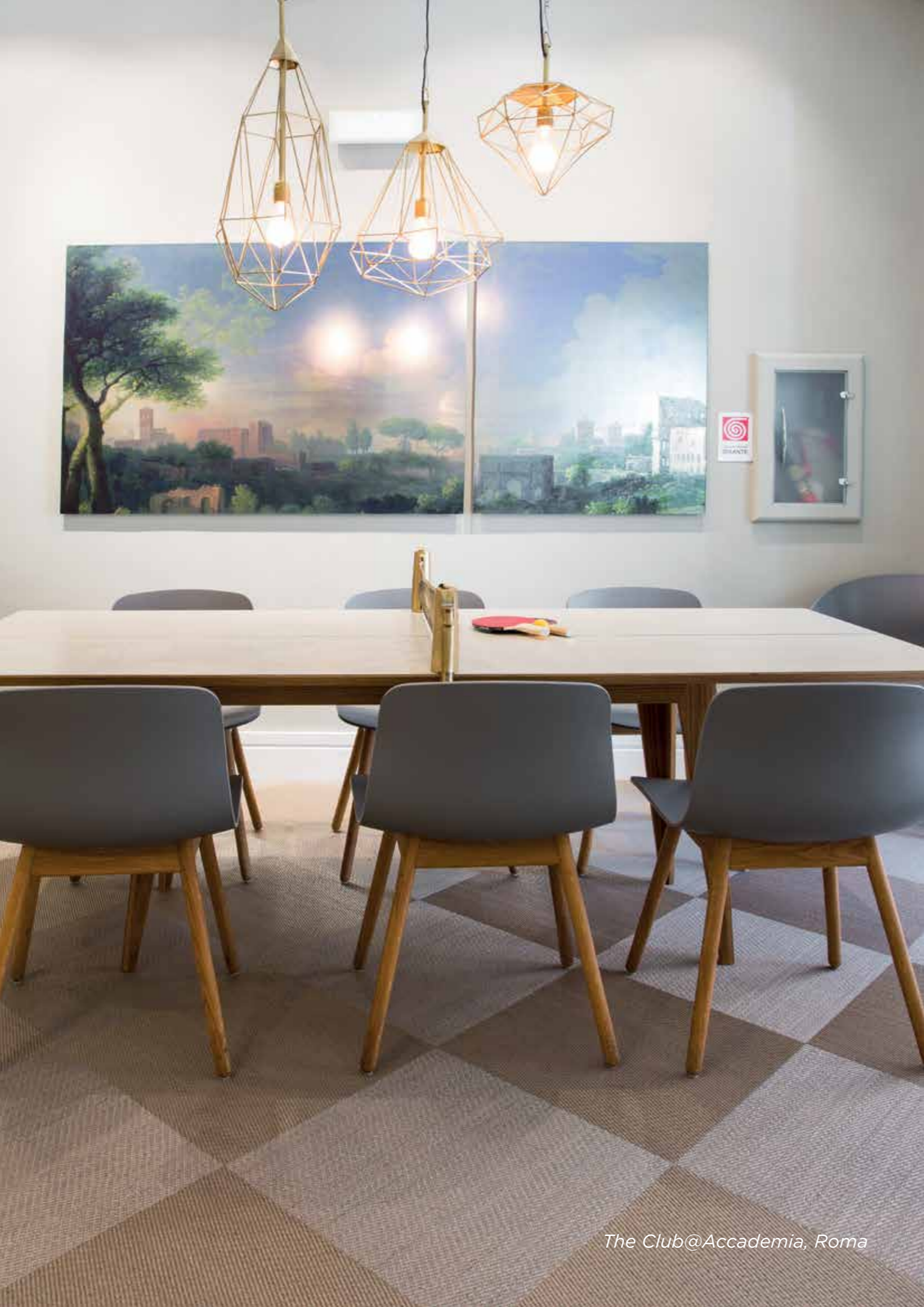
The Club@Accademia, Roma