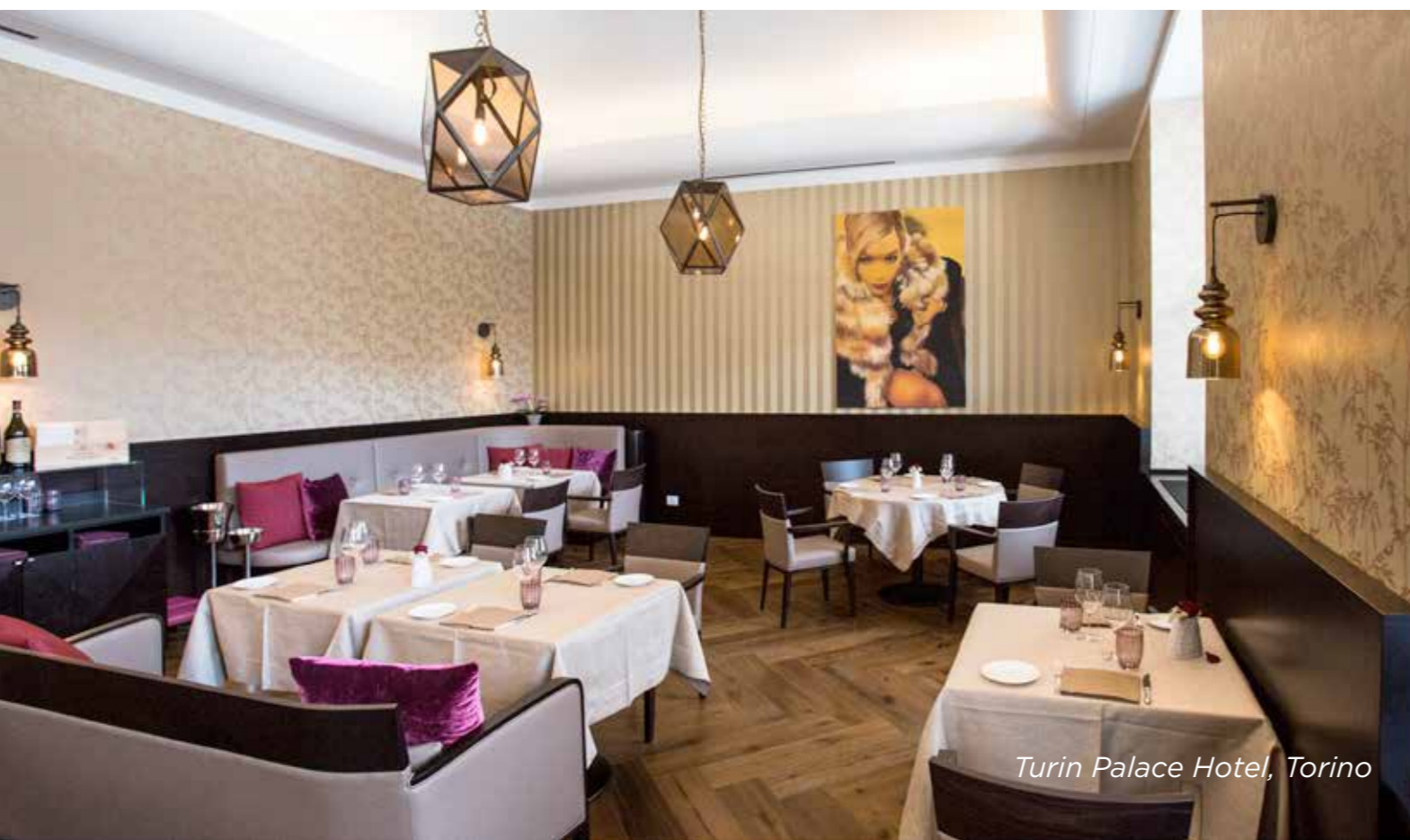
Turin Palace Hotel, Torino