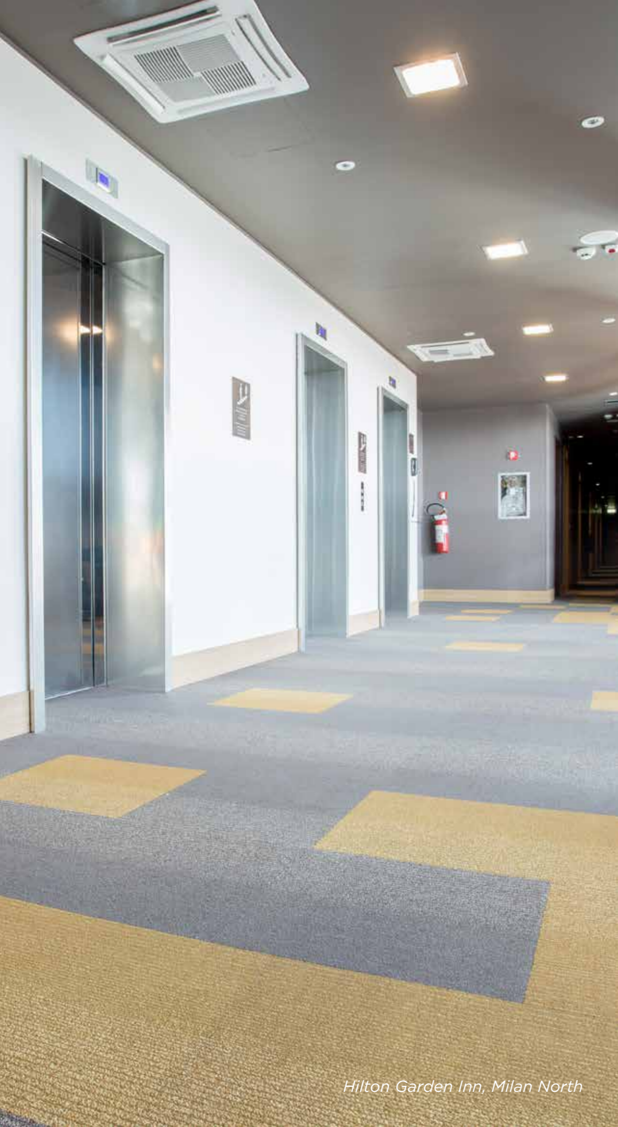
Hilton Garden Inn, Milan North