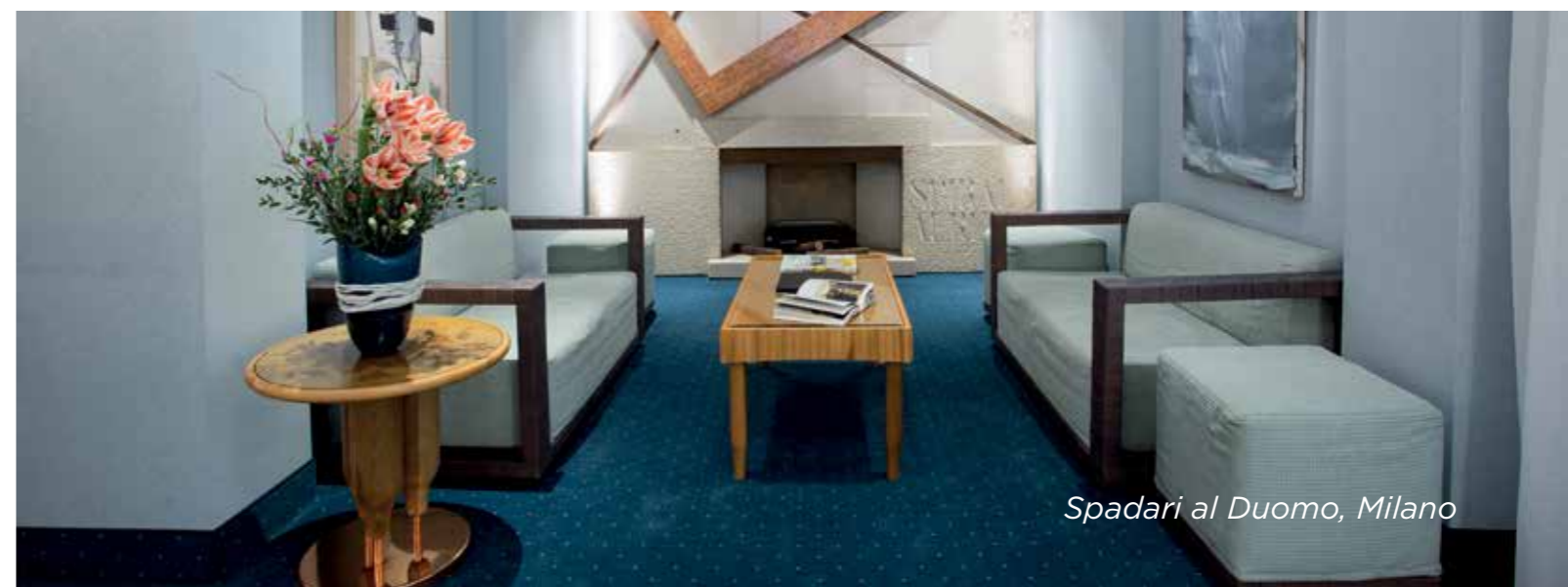
Spadari al Duomo, Milano

Tiles and rolls carpets, made with Solution Dyed yarns, resistant to aggressive chemicals, such as bleach, offer a flexibility and ease of use, which combined with a wide range of colors and types available, are well suited for hotels and residences common areas.