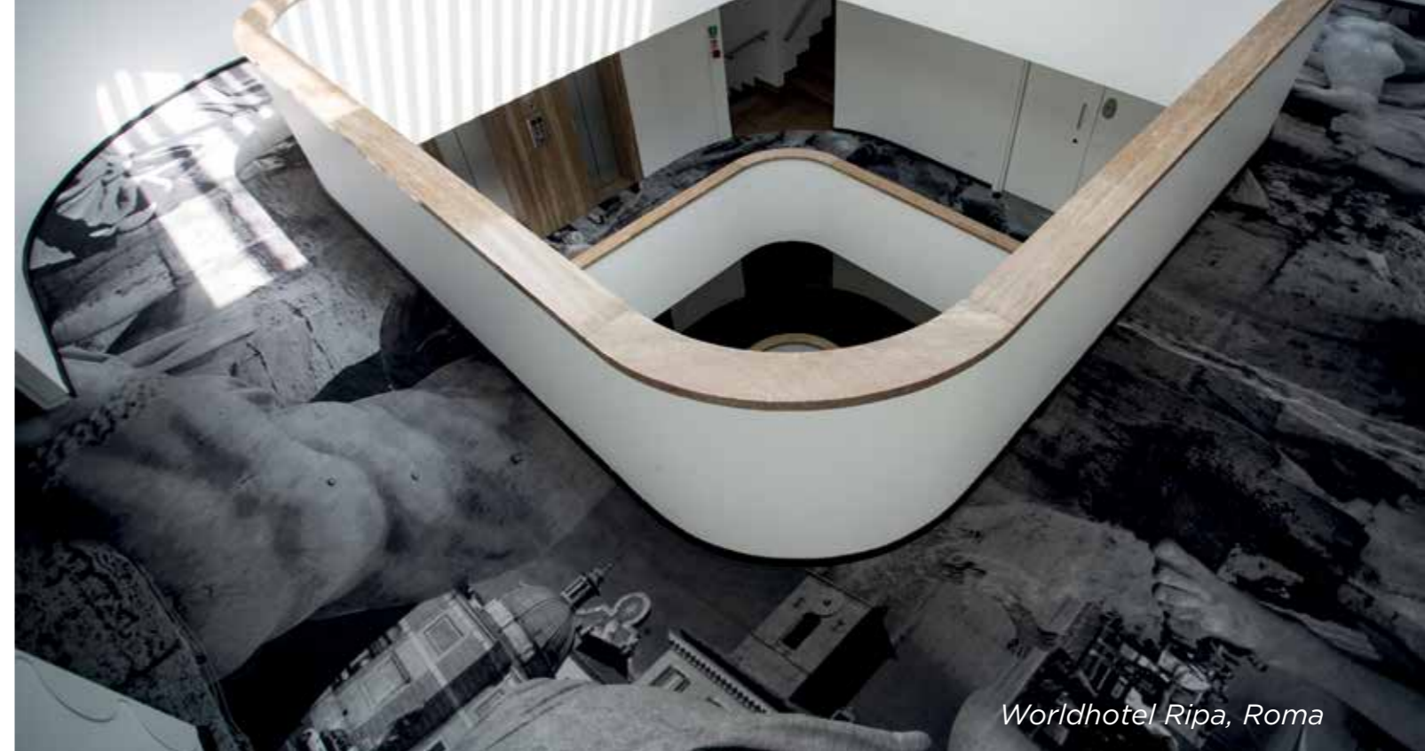
Worldhotel Ripa, Roma

Disponiamo di prodotti specifici per il settore alberghiero, tra cui tufted stampati, cross over, Axminster, Wilton e quadrotte autoposanti. La collezione Studio Hotel permette di soddisfare le più svariate esigenze estetiche e funzionali attraverso la personalizzazione di altissimo livello grazie a bordi, profili, loghi, marchi e sfondi coordinabili tra loro, che conferiscono all'ambiente la caratteristica dell'unicità.