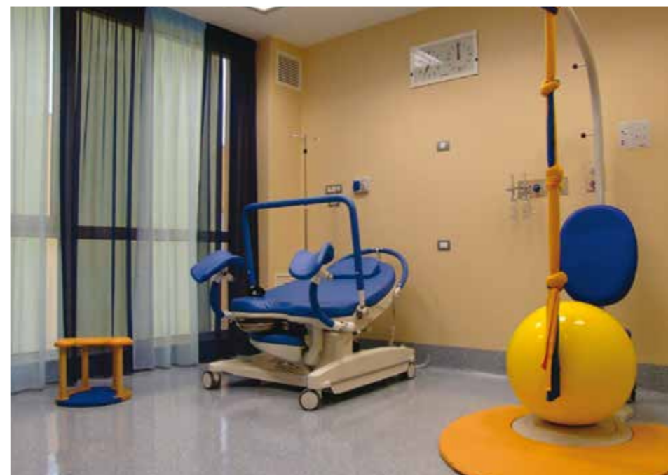
Ospedale F. Miulli, Bari - Serie ESA