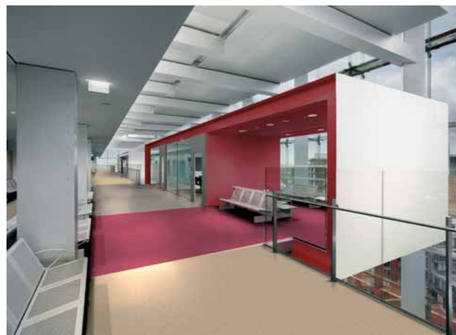
Pavimento vinilico Pearlazzo PUR