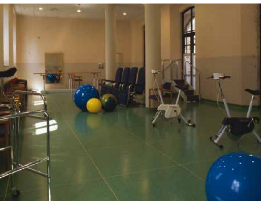
RSA Luigi Gonzaga, Gorla Minore (VA) - Serie ESA