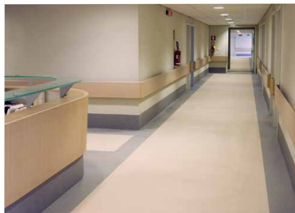
Università Campus Biomedico Trigoria, Roma - Serie ESA

La scelta delle finiture d'interni determina la qualità globale degli ambienti, per questo, nel mercato dei pavimenti e rivestimenti per ospedali e case di cura, Liuni propone esclusivamente prodotti con caratteristiche tecniche ed estetiche di alta qualità, tutti rigorosamente certificati.