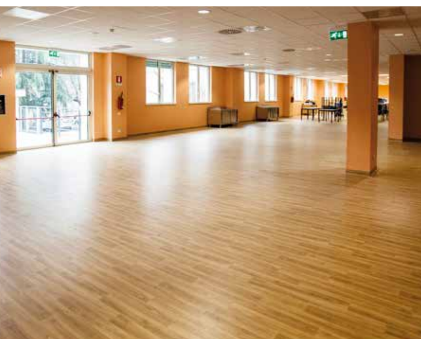
Pavimento vinilico stratificato Forest FX PUR