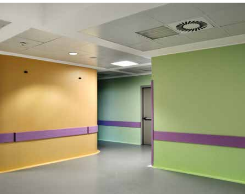
Ospedale Niguarda Ca' Granda, Milano - Serie ESA